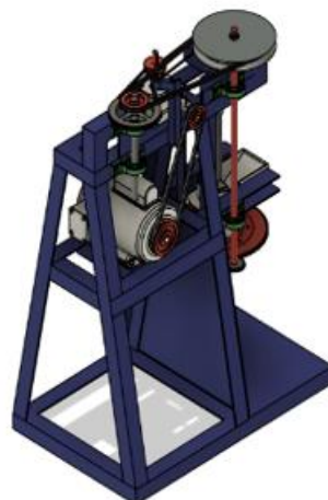
Gambar 4. Assembly Mesin

seluruh elemen mekanis terhubung dan berfungsi sesuai rancangan, sehingga mesin dapat bekerja secara optimal pada proses pengolahan adonan. Assembly mesin bisa dilihat pada Gambar 4.