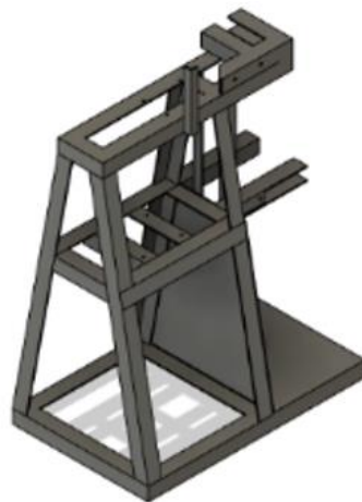
Gambar 3. Alternatif Fungsi Rangka