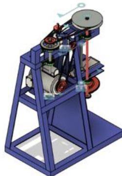
Gambar 5. Simulasi Pergerakan Mesin

Hasil ini membuktikan bahwa rancangan mekanis telah memenuhi tuntutan fungsional dan siap dilanjutkan ke tahap manufaktur fisik. Berikut adalah simulasi pergerakan dalam aplikasi Fusion 360.