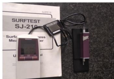
Gambar 2. Surface Roughness Tester

level 0,2 mm/put dan 0,16 mm/put. Jumlah sample penelitian sebanyak 24 sample yang dimana setiap sample memiliki 3 titik pengambilan data kekasaran permukaan. Setiap titik dilakukan 3 kali pengambilan data. Untuk alat uji kekasaran permukaan menggunakan Surface Roughness Tester Mitutoyo SJ-210.