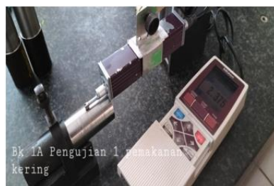
Gambar 3. Proses Pengukuran Kekasaran Permukaan